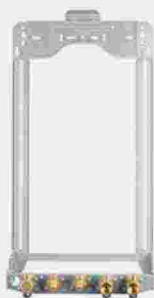
Fácil reemplazo: Dimensiones compactas

Destacan sus reducidas dimensiones, además de conexiones electrónicas sencillas y accesibles sin apertura de la carcasa, ya que cuenta con un mecanismo de abatimiento de robusto lo que permite instalar la caldera dentro o entre armarios, de cocina.